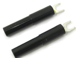
Końcówka widelkowa przewodu pomiarowego