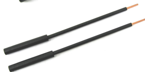
Końcówka przewodu pomiarowego Cu