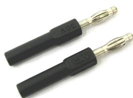
Adapter przewodu pomiarowego banan fi4

Akcesoria dodatkowe AKD100 to zestaw końcówek i chwytaków przeznaczonych do współpracy z przewodami pomiarowymi bezpiecznymi standardowego wyposażenia analizatora Calport 100.