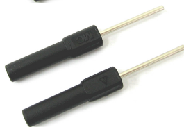
Końcówka 20/25 przewodu pomiarowego